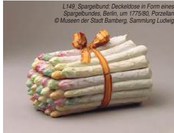
L149 „Spargelbund: Deckeldose in Form eines Spargelbundes, Berlin, um 1775/80, Porzellan © Museen der Stadt Bamberg, Sammlung Ludwig

Vom 29.März bis 26.Oktober widmet sich das Porzellanikon Hohenberg a.d. Eger in der Sonderausstellung „Fake Food“ der Frage, ob unser Essen schon immer eine Illusion war. Bereits im 18.Jahrhundert wurden aufwendig gestaltete Schaugerichte aus Porzellan und Fayence hergestellt, um natürliche Speisen zu imitieren - ein Trend, der sich heute mit Aromen, Zusatzstoffen und Ersatzprodukten fortsetzt. Die Ausstellung beleuchtet Ernährung, Porzellan und gesellschaftliche Fragen rund um Echtheit, Nachhaltigkeit und kulturelle Prägung unseres Essens. Besucher können interaktiv erkunden, was unsere Essgewohnheiten über sozialen Status, Regionalität und Saisonalität aussagen. An Mitmach-Stationen lassen sich Gerichte nicht nur sehen, sondern auch hören, tasten, riechen und schmecken. Ein besonderes Highlight ist die barocke Tafel, an der Besucher mittels Virtual Reality Platz nehmen können. Die Ausstellung verpricht eine spannende Reise durch die Welt des „Fake Food“ - damals und heute.