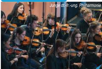
Junge dt.-fr.-ung. Philharmonie

Die Musica Bayreuth zündet in der neuen Spielzeit ein Feuerwerk an außergewöhnlicher und erhebender Musik verschiedener Epochen. Sie wird präsentiert von erlesenen Künstlern in erstaunlichen Räumen. Los geht es am Montag, dem 21. April, wenn die Junge deutsch-französisch-ungarische Philharmonie unter