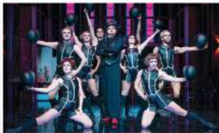
Cabaret Musical · 25.04.