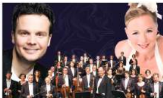
Große Operettengala · 05.04.