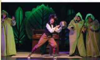
Flieg mit mir! Familienmusical · 06.04.