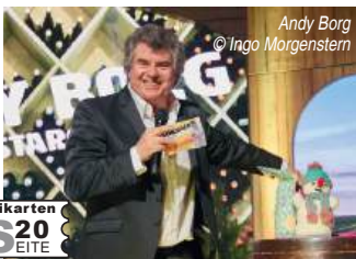
Andy Borg